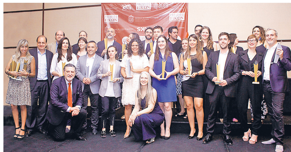
Así celebrábamos la primera entrega de los Premios EIKON Chile el 13 de noviembre de 2019, ocasión en la que fueron galardonados 23 casos. En este 2020, esta ceremonia no pudo realizarse de manera presencial por causa de la actual pandemia.