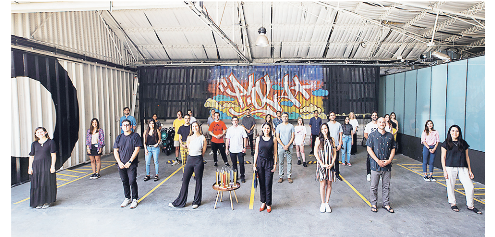
▲ Equipo completo de ALTA COMUNICACIÓN CHILE.