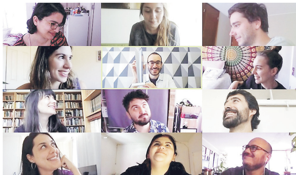
▲ REACTOR AGENCIA DIGITAL: Los equipos de Contenido, Diseño y Web.