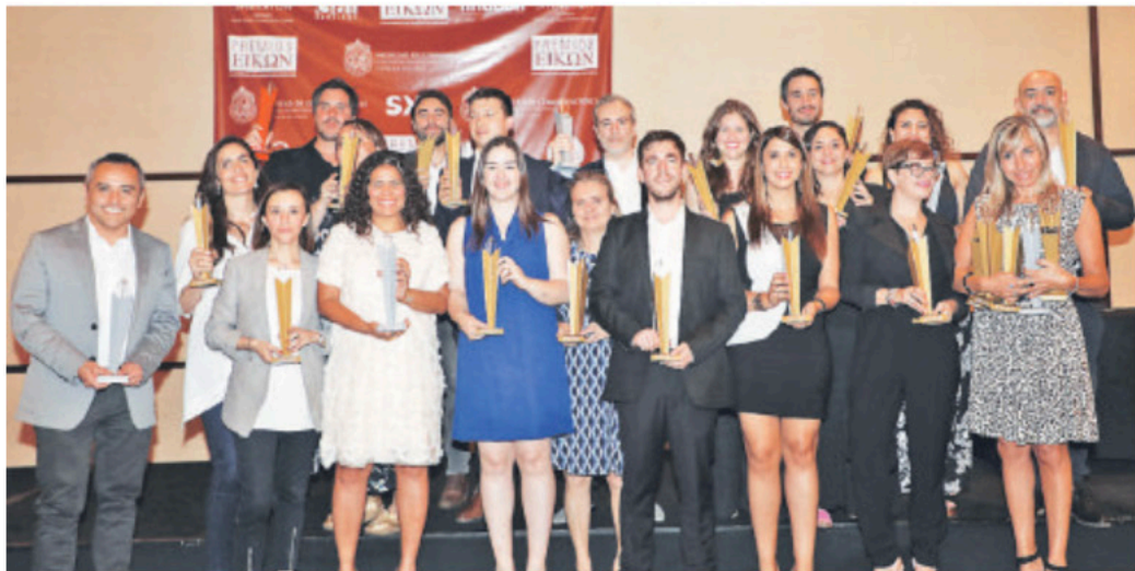
◀ Todos los ganadores de las 23 casos de los Premios EIKON.

Los EIKON son el premio más importante de América Latina a la comunicación institucional. La clave de su relevancia es el prestigio de su jurado, conformado por profesionales destacados del sector de la comunicación corporativa, periodistas, publicistas y académicos.