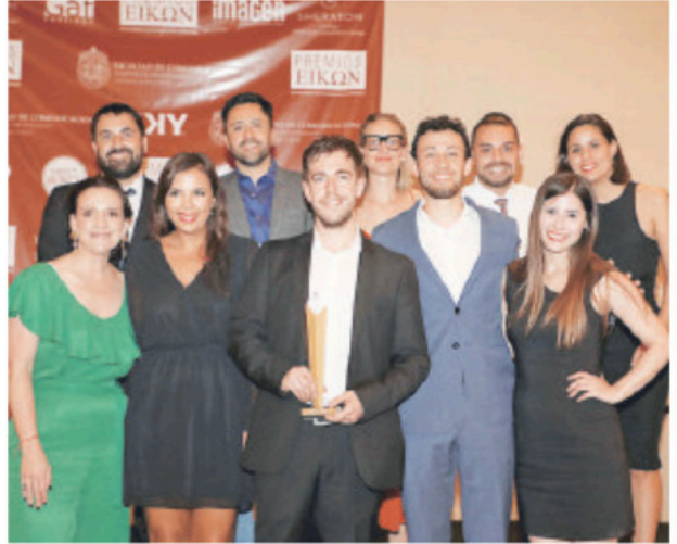
▲ El equipo de Grupo Urban premiado en las categorías "Campaña general de comunicación institucional" y "Campaña marketing social".